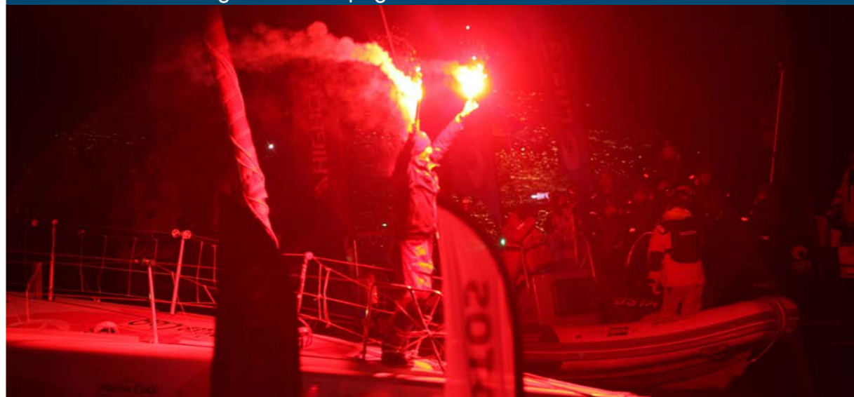
Feux de détresse à bout de bras, Jérémie communique avec l'immense foule massée autour du chenal du port des Sables.