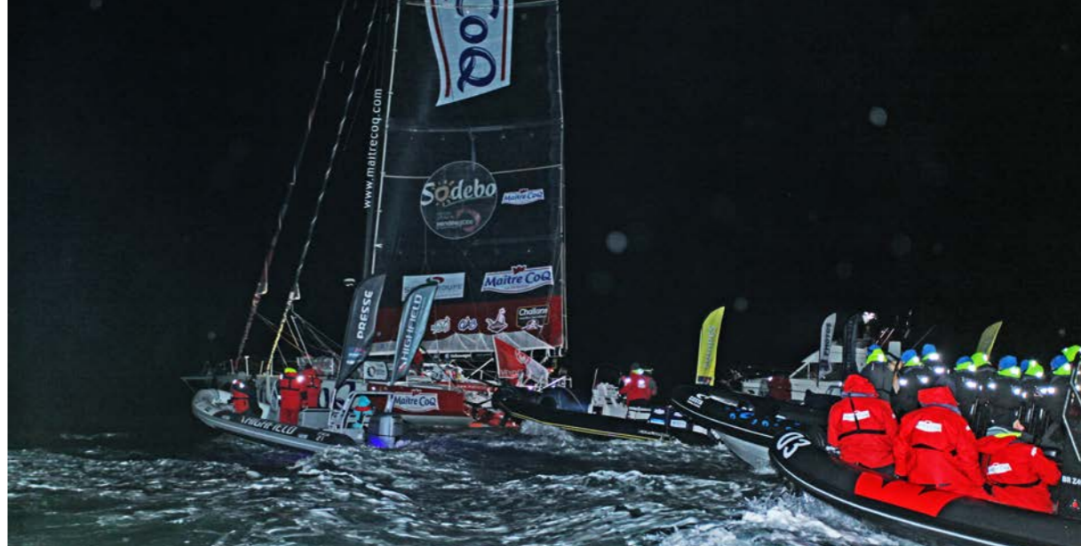
Dans la nuit d'encre, les derniers milles de Maître Coq ont pu se faire à allure soutenue. Une cohorte de semi-rigides l'accompagne...