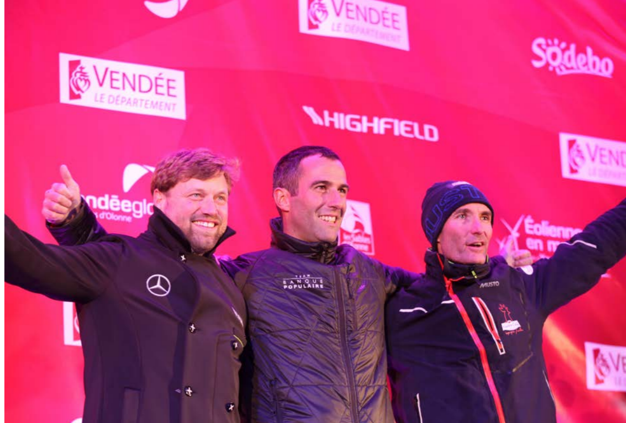
Beau podium pour cette huitième édition du Vendée Globe : Alex Thomson et Jérémie Beyou encadrent le vainqueur, Armel Le Cléac'h.

Vers 23h30, ce fut l'arrivée au ponton, sous les encouragements nourris où, respectueux de la tradition, il a fait sauter le bouchon de champagne, sans omettre de boire une gorgée du précieux nectar. Il a ensuite répondu, euphorique mais très lucide, aux innombrables micros tendus vers lui. Envolée la fatigue ! Une fois à terre, il a filé sur le podium pour répondre à la longue série de questions d'un journaliste de l'organisation, devant un parterre de presse et d'invités fournis. Puis, il a disparu un bon moment pour aller se changer, avant de pousser la porte du barnum privatisé par son sponsor principal, Maître Coq. Là, des centaines d'invités (dont nous étions), ont pu « toucher » leur héros qui s'est à nouveau fendu d'un speech, où l'émotion était palpable. Deux heures plus tard, un premier verre de bière à la main, il était encore là, à se prêter aux selfies... Pour Jérémie Beyou, un podium au Vendée, ça se partage !