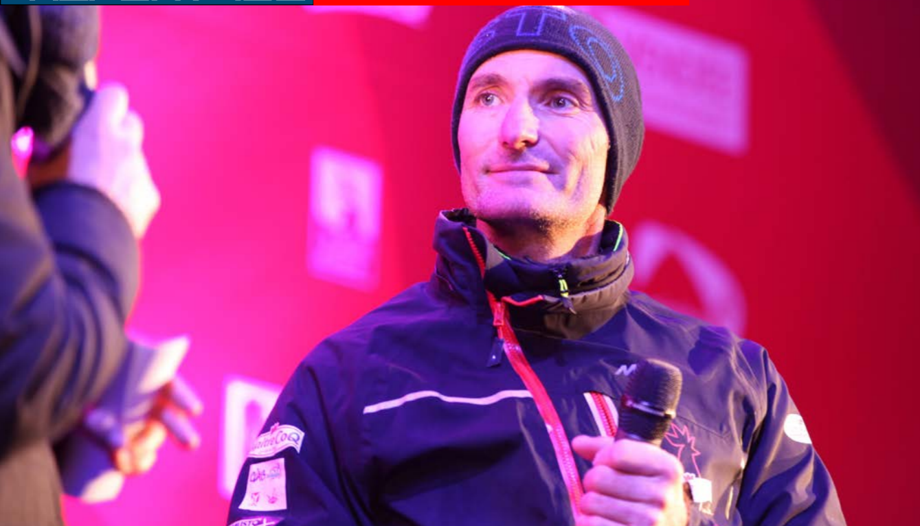
A peine mis pied à terre, il est interviewé sur le podium de l'organisation, où il rend un hommage appuyé à sa fidèle équipe qui a travaillé dans l'ombre.