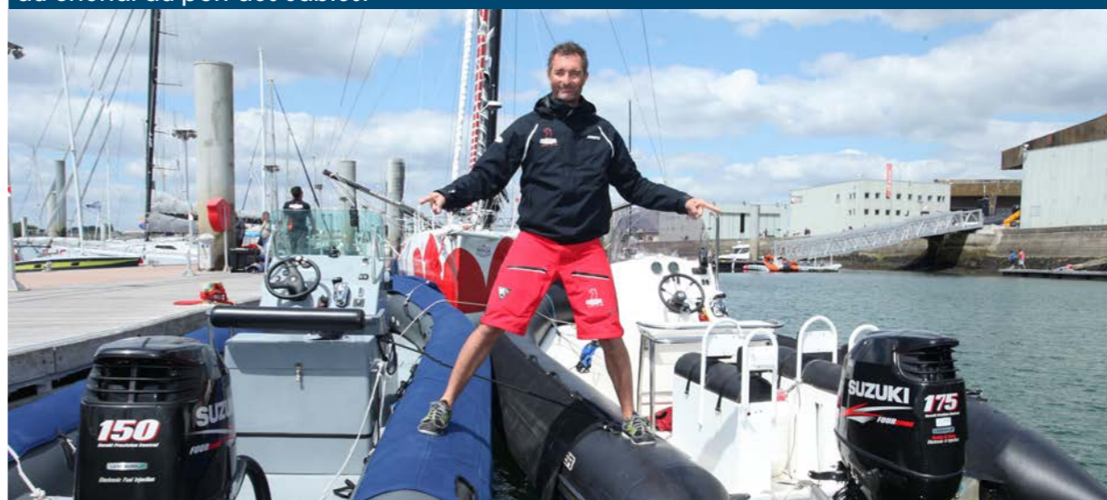
Debout sur ses deux bateaux de servitude, motorisés par Suzuki. C'était à Lorient, lors de notre visite de l'été dernier.